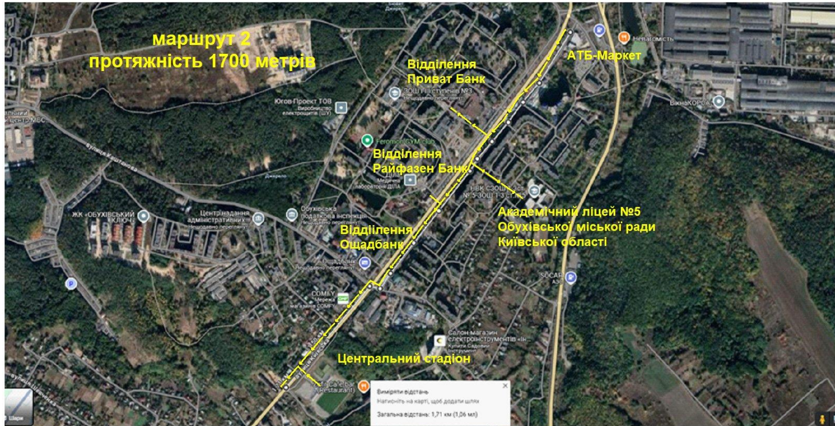
Схема безбар'єрного маршруту 2 – перший етап