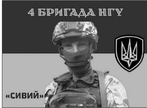
Бахмут, перед пораненням. 2022 рік

перше поранення, третю групу інвалідності і посвідчення учасника бойових дій. Після лікування і реабілітації підписав контракт з Національною поліцією, став служити старшим лейтенантом патрульної поліції в Обухівському районному відділку.