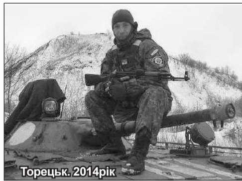
Торецьк, 2014 рік