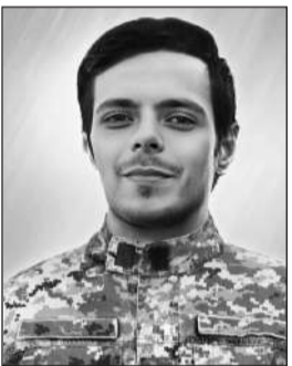
САВЧЕНКО АНДРІЙ МИКОЛАЙОВИЧ