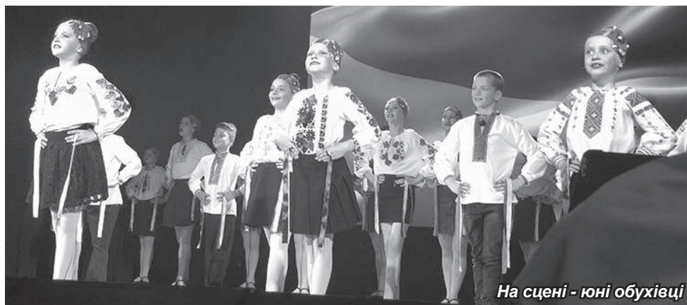
На сцені - юні обухівці

У вчорній заповненому залі ОЦКД урочистості розпочалися з Державного Гімну України. Славень держави виконав народний хор Київського КПК «Явір».