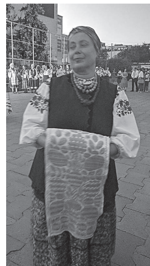
Демонстрація автентичного українського вбрання від Обухівського народного мистецького центру «Правічне дерево життя»