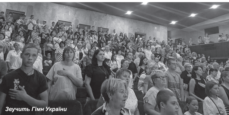
Зеучить Гімн України