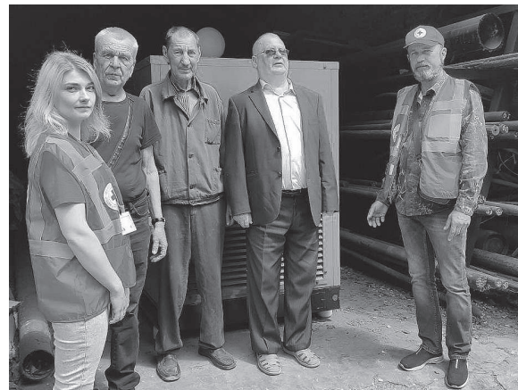
Обухівське виробниче підприємство УВП УТОС отримало від представників Червоного Хреста потужний дизельний генератор.

Відділ обслуговування громадян №13 (сервісний центр) управління обслуговування громадян Головного управління Пенсійного фонду України у Київській області