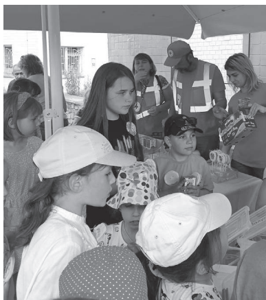
Міська районна організація ТЧХУ провезла захід до Дня захисту дітей.

хто звертається до нас. Зокрема, у липні передали пральню-сушильні машинки до дитсадочка «Світлячок», міського центру медико-санітарної допомоги, Васильківської та Кагарлицької лікарень.