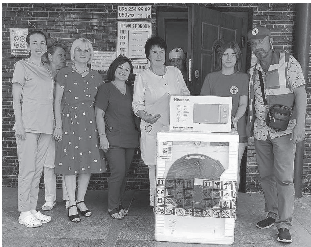
Пралкою та мікрохвильовкою поповнилися Обухівська стоматологічна поліклініка.

вибрати собі речі до сезону. Запрошую небаждужих мешканців громади поповнювати наш речовий склад.