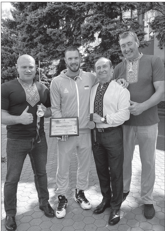
Івану Семикіну та його команді за гідне представлення України і, зокрема нашої Обухівщини, на світовій спортивній арені.

28 червня, на День Конституції України, відомому українському спортсмену, чемпіону світу з веслування на байдарках та каное Івану Семикіну Обухівська міська рада присвоїла звання «Молода людина року».