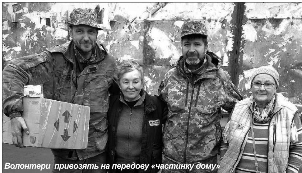
Волонтери привозять на передову «частинку дому»