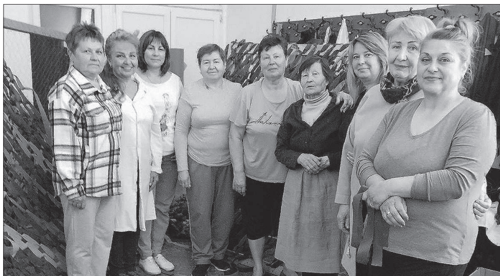
Волонтерки «Материнського серця» біля виготовлених маскувальних сіток