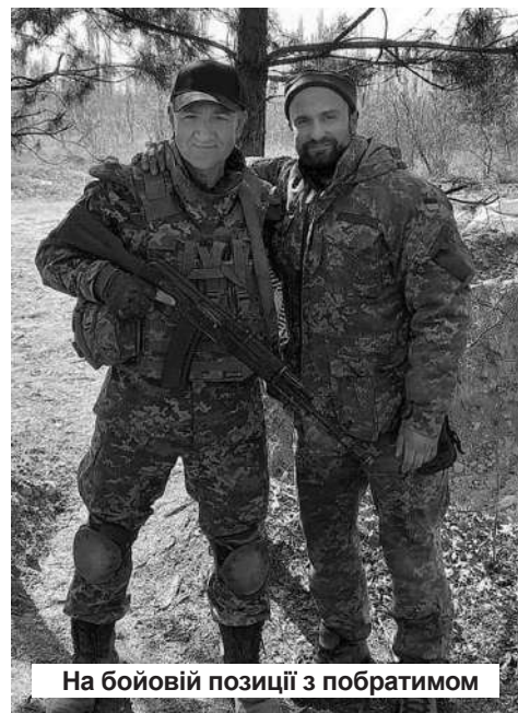
На бойовій позиції з побратимом