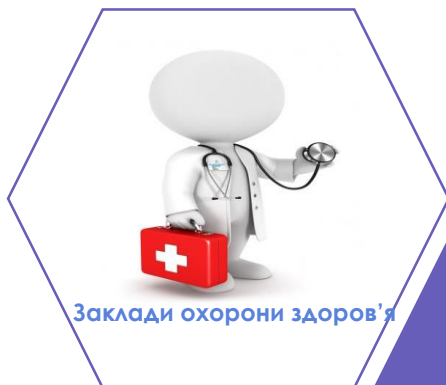
Заклади охорони здоров'я

соціальні послуги відповідно до індивідуального плану соціального захисту дитини