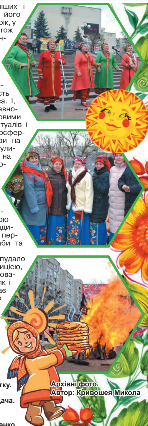
Архівні фото. Автор: Кривошея Микола