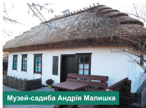
Музей-садиба Андрія Малишка