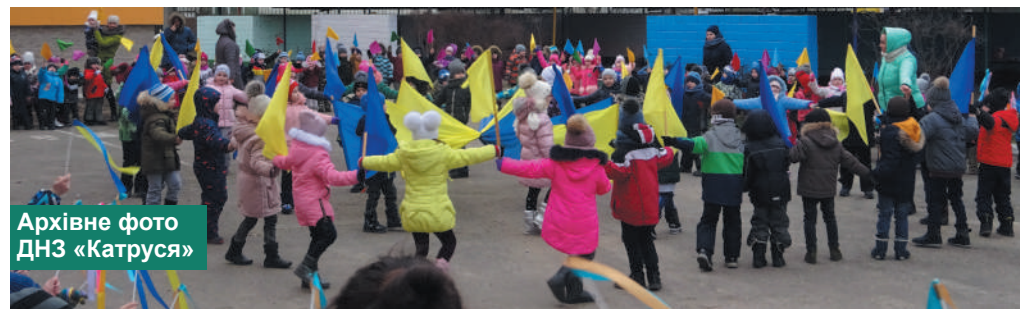
Архівне фото ДНЗ «Катруся»

При вході з вулиці Володимирської на Софійську площу було зведено тріумфальну арку зі старовинними гербами. Урочиста церемонія проголошення Акта Злуки розпочалася рівно о 12:00 години, в першу річницю проголошення четвертого Універсалу про повну незалежність України. Посол Західноукраїнської Народної Республіки Л. Цегельський привселюдно зачитав та передав грамоту Національної Ради «Про об'єднання Західноукраїнської Народної Республіки з Великою Східною Україною» голові Директорії Володимир Винниченку.